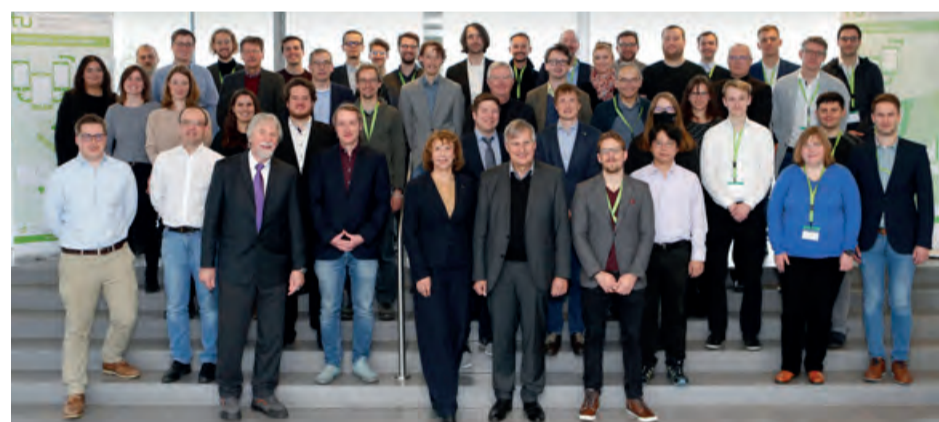
Zum Abschluss des SFB 876 kamen die Beteiligten im Rudolph-Chaudoire-Pavillon zusammen.