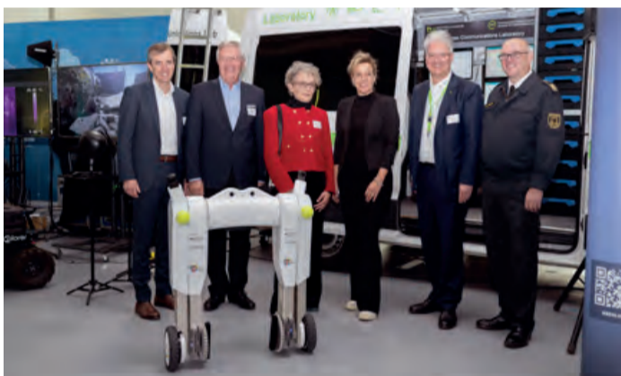
Mona Neubaur (3.v.r.) besichtigte Exponate der 5G.NRW-Projekte und des 6GEM-Forschungshubs.