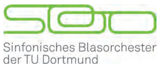
Sinfonisches Blasorchester der TU Dortmund

Ein „Best of SBO“ bot das Sinfonische Blasorchester (SBO) der TU Dortmund Mitte November im Audimax unter der Leitung von Constantin Hesselmann.