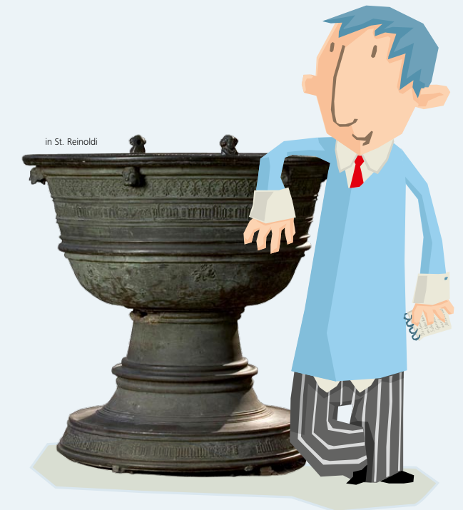
in St. Reinoldi

»St. Petri: Ist das die Kirche bei Saturn?« – wird man in Dortmund immer wieder einmal gefragt. Wie nehmen wir unsere eigene Stadt wahr? Mit welchen Orientierungsmarken erschließen wir uns den städtischen Raum? Welche Bedeutungen messen wir der städtischen Topographie bei? Und welche Rolle spielen in dieser Weltorientierung die Erinnerungs- und Kulturorte, die der gegenwärtigen Stadt Zugang zu ihrer bedeutenden Vergangenheit eröffnen?