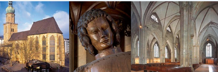
Stadtkirche St. Reinoldi