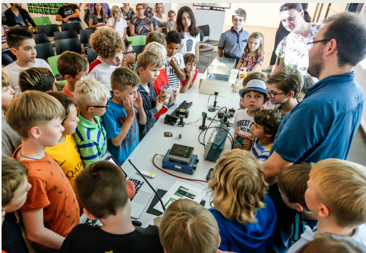
Bild rechts: KinderUni SoSe 2018, »Vielfalt: Gemeinsam sind wir stark!« Bild unten: KinderUni SoSe 2018, »Licht und Laser«

Wenn ein Experiment nicht leicht gestört werden kann, ist das super. Aber wie erreicht man das? Ein toller Trick ist, dass man ganz robuste Eigenschaften ausnutzt, z. B. wie viele Löcher ein Körper hat. Das kann nämlich nicht leicht geändert werden. Man müsste schon bohren oder kleben, nur kneten reicht nicht! Oder man schaut, welche Winkel auf krummen Flächen auftauchen. Damit kann man elektrischen Strom wahnsinnig genau messen – und drei Nobelpreise gab es für solche robusten Effekte auch schon. Das wollen wir in dieser KinderUni erklären.