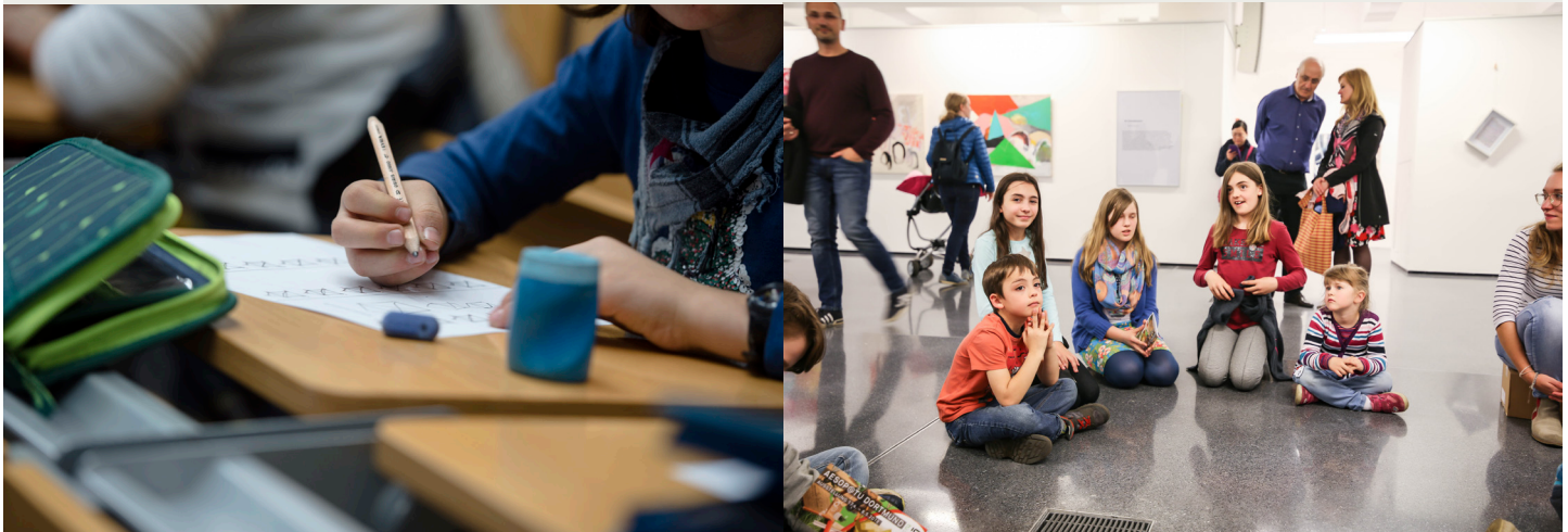
KinderUni SoSe 2018, »Die Fabeln des Äsop«