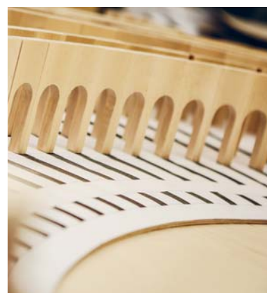
Das Colosseum ist ein weiteres Objekt, das im Wahlpflichtfach Modellbau hergestellt wird. Hieran arbeiten derzeit insgesamt sieben Studierende. Der Bau dauert rund sechs Monate.