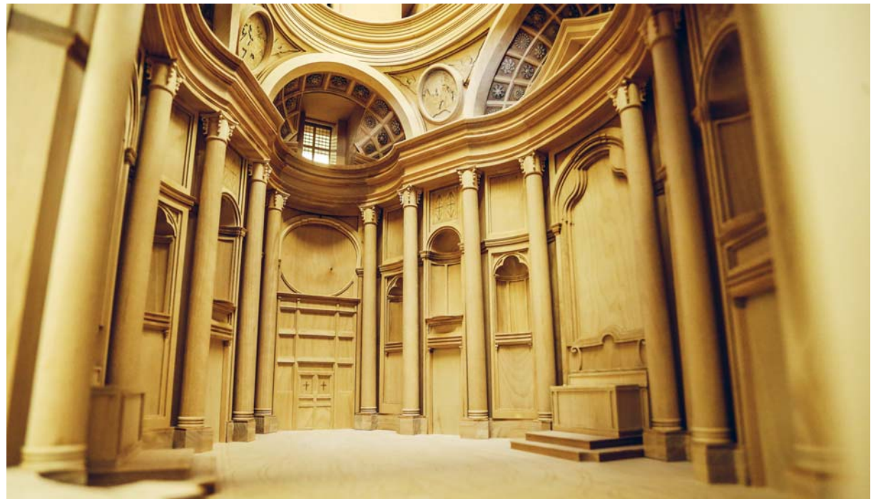
San Carlo alle Quattro Fontane: Architekturstudierende der TU Dortmund bilden die berühmte Kirche des Architekten Francesco Borromini, die im 17. Jahrhundert in Rom erbaut wurde, als Modell aus Holz nach. Die Bauzeit beträgt 15 Monate.