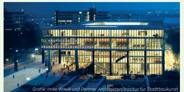
Grafik: Imke Woelk und Partner Architekten/Institut für Stadtbaukunst

Universitätsbibliothek wird modernisiert