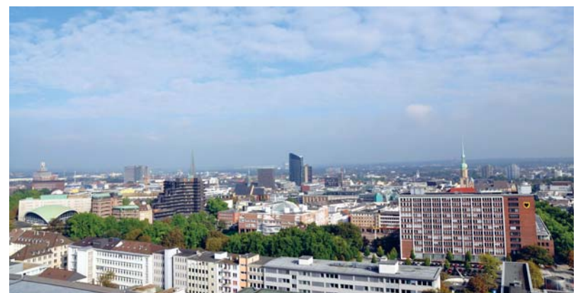
Nach dem Studium ein Job in der Region: An der TU Dortmund machen jährlich über 4.000 Absolventinnen und Absolventen ihren Abschluss. Sie sind bei potenziellen Arbeitgebern hoch geschätzt. Rund 60 Prozent von ihnen bleiben in der Region.

Für die aktuelle Sonderauswertung wurden die Antworten von 186 deutschen Unternehmen herangezogen. Ergebnis ist ein Ranking der Hochschulen, die die besten Absolventinnen und Absolventen hervorbringen – nicht nur gemessen an ihrem Fachwissen, sondern auch an ihren Soft Skills.