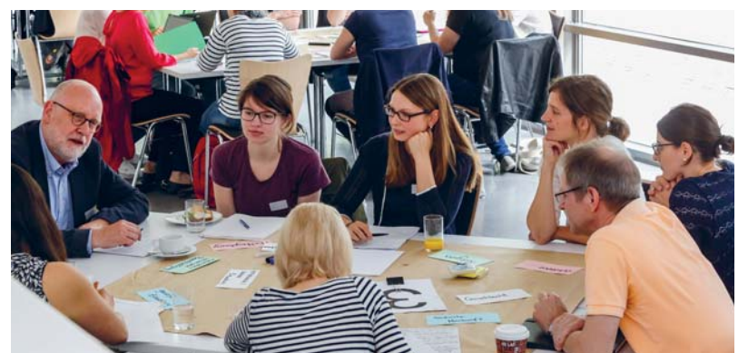
Beim World-Café kam es zum Austausch von Expertinnen und Experten der TU Dortmund mit Externen zu den Zielen und Möglichkeiten des Projekts DoProfil.