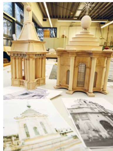
Von der alten Kirche gibt es keine Pläne. Das heißt: Die Studierenden müssen alle Proportionen und Details auf Basis von Fotografien rekonstruieren – und dann sorgfältig in Handarbeit herstellen.

Die Modellbauwerkstatt auf dem Campus Süd gehört zur Fakultät Architektur und Bauingenieurwesen. Dort wird nach dem „Dortmunder Modell Bauwesen“ gelehrt. Das bedeutet: Studierende lernen zusätzlich zum eigenen Fach auch die Zusammenarbeit mit allen anderen am Bau beteiligten Disziplinen kennen. Für das nächste Wahlpflichtfach plant Dirk von Kölln, mit seinen Studierenden einen Teil eines Hauses zu bauen – „sogar zusammen mit Fachfirmen, ganz nah an der Praxis“, sagt er.