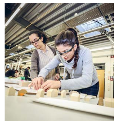
Studierende bauen in der Werkstatt auch die Modelle für ihre Abschlussarbeiten. In der Regel arbeiten hier etwa 30 Personen gleichzeitig. Wenn Abgaben anstehen auch bis zu 60.