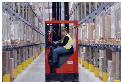
Wandel in Produktion und Logistik: Von der Ausführung zu Steuerung und Überwachung. Eine Herausforderung für Unternehmen.

Dem betrieblichen Kompetenzmanagement kommt vor diesem Hintergrund eine Schlüsselrolle zu. Mit einer berufs begleitenden Kompetenzentwicklung kann eine hohe Leistungsfähigkeit im gesamten Erwerbsleben