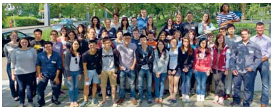
34 Internationale Studierende sind derzeit zu Gast an der TU Dortmund.

Herzlich Willkommen! Die TU Dortmund hat auch in diesem Jahr Studierende aus der ganzen Welt zum International Summer Program (ISP) begrüßt. Insgesamt 34 Studierende aus Brasilien, Hongkong, Kanada, Mexiko und den USA nehmen daran