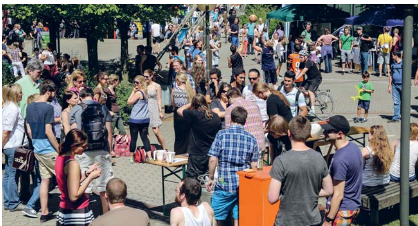
Bei strahlendem Sonnenschein tummelten sich am 3. Juli zahlreiche Studierende und Beschäftigte mit Freunden und Familien auf dem vierten Sommerfest der TU Dortmund und freuten sich über spannende Vorführungen, mitreißende Musik und kulinarische Kostproben.