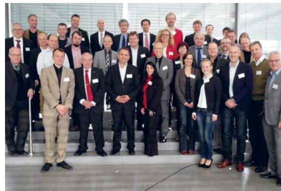
Mit mehr als 30 Gästen feierten die beteiligten Wissenschaftlerinnen und Wissenschaftler der Fakultät für Chemie und Chemische Biologie sowie der Fakultät Bio- und Chemieingenieurwesen die Gründung des Zentrums für integrierte Wirkstoffforschung (ZiW) an der TU Dortmund.

Forscherinnen und Forscher aus dem akademischen Bereich sollen die Möglichkeit erhalten, ihre innovativen Wirkstoffe in professioneller Umgebung zu prüfen und das Erfolgspotenzial signifi-